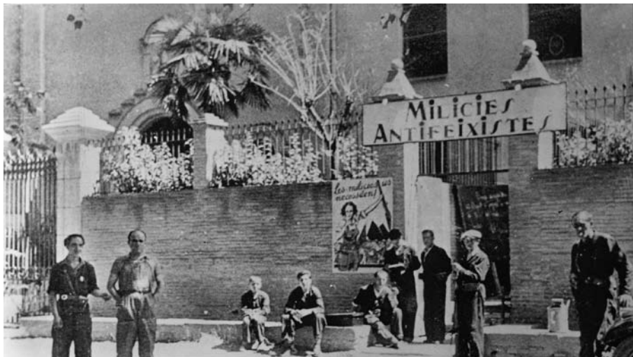
Milicians davant el quarter de les Milícies Antifeixistes establert al convent del Sagrat Cor (1936), a la carretera de Barcelona (ara passeig de la Generalitat).