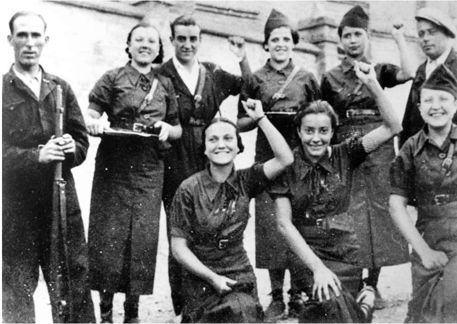
Milicians i milicianes, eufòrics, davant la tanca del quarter del convent del Sagrat Cor.

estat possible, hem ordenat els fets en els quals es veu implicat per ordre cronològic. Alguns dels episodis estan contrastats per dues o més fonts independents o bé per fonts molt segures (testimonis directes), la qual cosa els dona garantia de quasi total veracitat. D'aquest enfilall de notícies se'n desprèn, creiem, que, efectivament, com alguns historiadors i memorialistes ja han dit, Vicenç Coma no era un milicià més, sinó que devia ser una peça clau en la cadena de comandament que anava de la cúpula del Comitè a les patrulles de milicians, entre els que decidien les morts i els encarregats d'executar-les. És particularment revelador en aquest sentit que en molts casos sigui ell, i no pas un altre dels seus companys, la persona que pren les decisions, que té el protagonisme més gran o, fins i tot, que s'adreça a la víctima o al testimoni que després ens ho ha comptat.