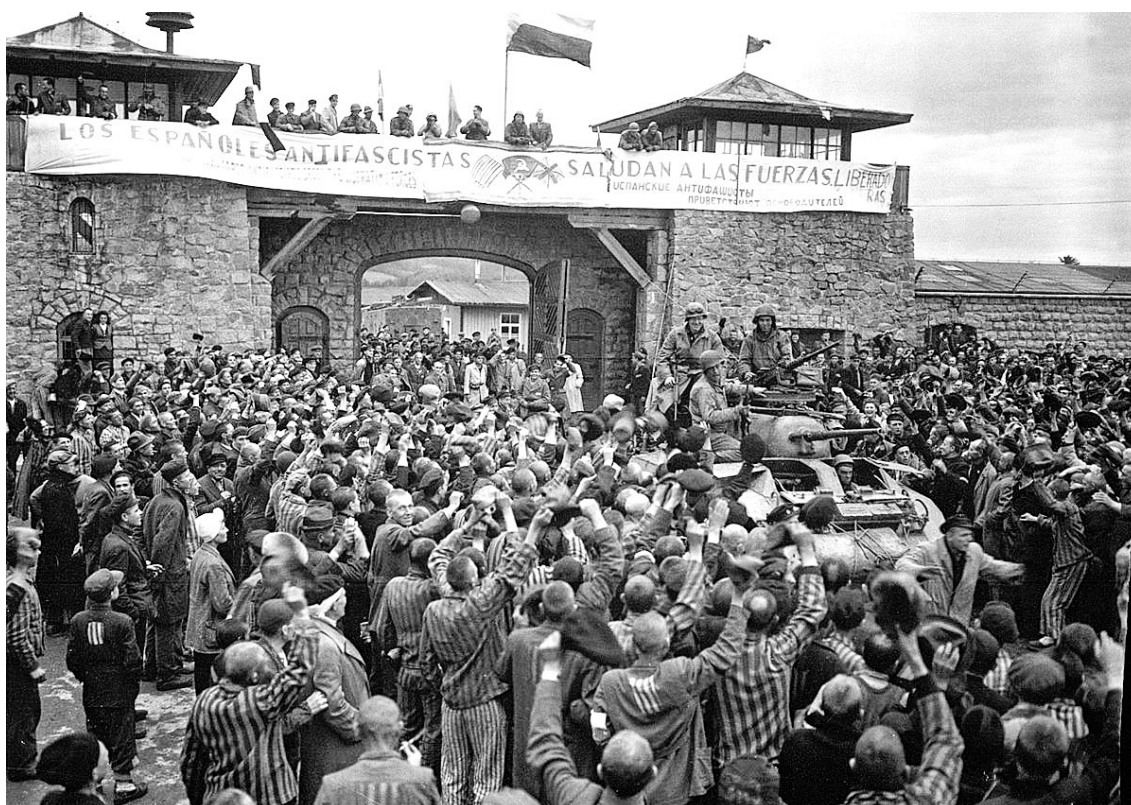
Imatge del 5 de maig de 1945, quan tropes aliades alliberen el camp de Mauthausen |