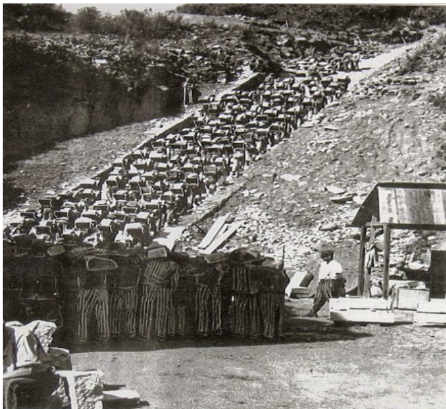
La Todesstiege, l'escala de 186 graons, dita de la mort, de Mauthausen