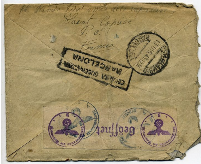
Sobre de la carta del 25 de novembre de 1943